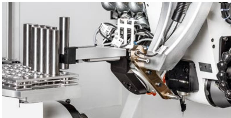
Option Top Lader

Productivity Package (24 kW-Spindel und Glasmaßstäbe); Toplader; HSK-Spindel; Messtaster zum Vermessen der Schleifscheiben; Manuelle Stützlünette; Manueller Reitstock; Werkstückträger mit Torquemotor; Schärfsteinhalterung; Obertisch; Dunstab-scheider; Schalldämpfer; Feuerlöschanlage; Automatisches, elektrisches Messen der Maschinenreferenz (AEMDM); etc.