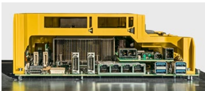
MMI-Rechner montiert auf der Rückseite vom Bildschirm